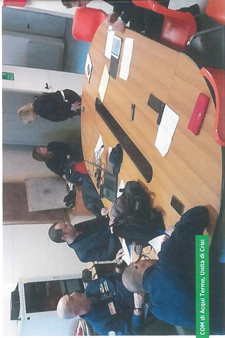
COM di Acqui Terme, Unità di Crisi